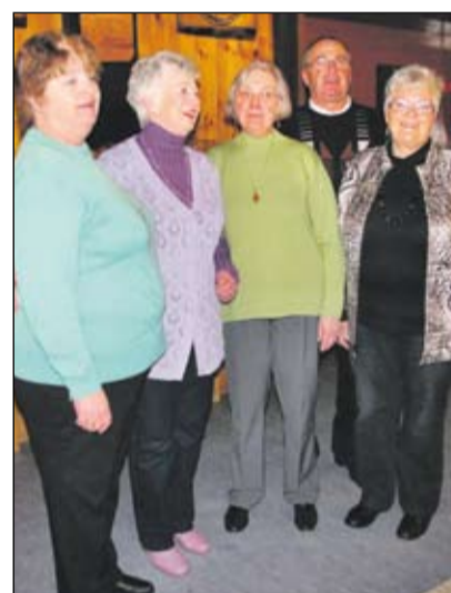
Ortsverband Rechtes Weserufer