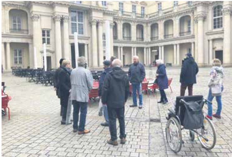
SoVD-Spaziergang der Landesgeschäftsstelle

Mit dem in Auftrag gegebenen Gutachten hat der SoVD wichtige Vorarbeit geleistet, um die Rechte von Patient*innen zu stärken. Nachzulesen ist es in der Februar-Ausgabe „Soziales im Blick“.