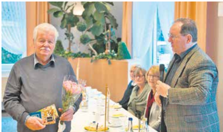
Ortsverband Elmshorn / Sparrieshoop