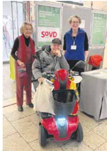
OV Stadtverband Berlin-Ost