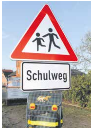
Kinder brauchen Schutz – und gleiche Chancen im Leben.

Von Armut betroffen oder bedroht sind vor allem Kinder in Alleinerziehenden- und Mehrkind-Familien. Junge Erwachsene in Hamburg trifft Armut noch mehr: Fast jede*r Dritte (29 Prozent) zwischen 18 und 25 ist gefährdet, so die Studie; Frauen stärker als Männer (31 und 27 Prozent). Insgesamt haben junge Erwachsene das höchste Armutsrisiko aller Altersgruppen – in allen Bundesländern. „Viele dieser jungen Menschen oder Familien mit Kindern brauchen Sozialleistungen wie Bürgergeld. Aber die Regelsätze sind zu niedrig, gerade angesichts der Inflation“, so Wicher. „Wir fordern nicht nur die Erhöhung des Bürgergeldes um mindestens 150 Euro, sondern auch eine schnelle Umsetzung der geplanten Kindergrundsicherung.“