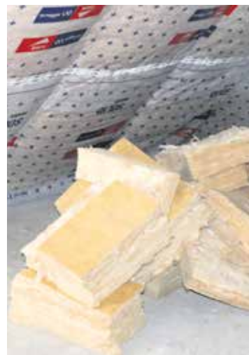
Wärmedämmung etwa ist teuer.

schaft führt er aus: „Gesunde Nahrung muss auch möglich sein bei wenig Einkommen oder Rente“; zu Wohnen und Bauen: „Wärmeisolierung und Photo-